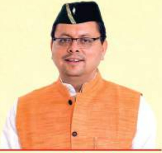
पुष्कर सिंह धामी मुख्यमंत्री, उत्तराखण्ड