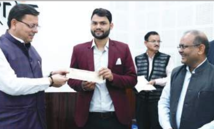
उतराखंड के मुख्यमंत्री पुष्कर सिंह धामी ने रविवार को मुख्यमंत्री केंप कार्यालय, देहरादून में राज्य सम्पत्ति विभाग के अन्तर्गत स्वागती पद पर 8 सस्तुत अभ्यर्थियों को नियुक्ति पत्र वितरित किए।

प्रदेश में ही है। लिहाजा गांगेय डॉल्फिन की संख्या भी उत्तर प्रदेश में सर्वाधिक है। एक अनुमान के मुताबिक अगर इनकी कुल संख्या 2000 के आसपास है तो उत्तर प्रदेश में इनकी संख्या 1600 से 1700 तक हो सकती है। ऐसे में इनके संरक्षण और संवर्धन की सर्वाधिक जिम्मेदारी भी उत्तर प्रदेश की ही बनती है। राज्य के जलीय जीव का दर्जा देकर योगी सरकार ने इस बाबत प्रतिबद्धता भी जताई है। इसी वजह से आने वाले कुछ वर्षों में ये गंगा नदी के आकर्षण का केंद्र बनेगी। डॉल्फिन मछली नहीं ममल (स्तनधारी) जीव हैं। ये मछली जैसे अंडा नहीं देती।